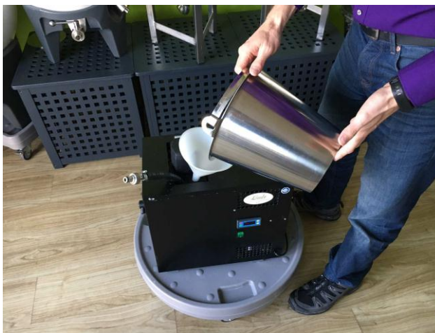
Заполните резервуар водой до отверстия перелива. При целевой температуре охладителя ниже 2°C бак следует заполнить хладагентом (пропиленгликолем).