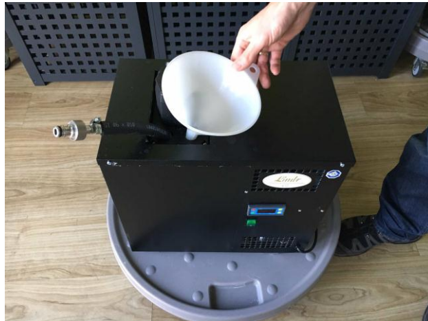
Вставьте воронку в отверстие верхней крышки блока-охладителя.